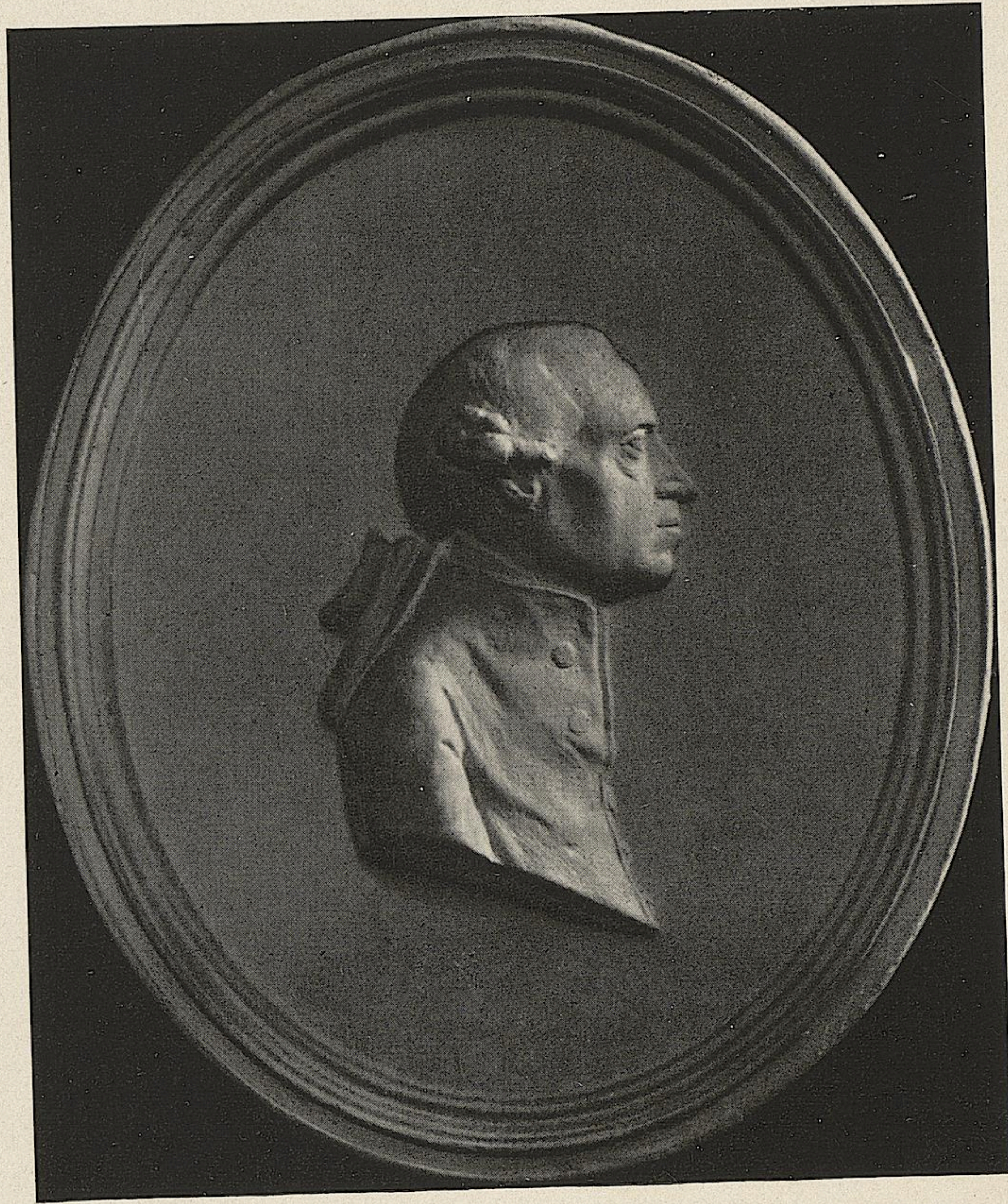
Abb. 919. Kunstgewerbemuseum der Stadt Königsberg i. Pr. Kantbildnis in Basaltmasse, 1782. Kleinbildner P. H. Collin, Königsberg i. Pr.

Im Jahre 1782 werden ferner in mehreren Buchhändler-Anzeigen die Bildnisse des Herzogs und der Herzogin von Curland in schwarzer Basaltmasse, zusammen für drei Taler, angeboten. Auf der Bildnisplatte mit der Herzogin in Dreiviertelprofil im Kunstgewerbemuseum in Königsberg, Nr. 2206, steht die Umschrift: „Dorothea Ducissa Curlandiae Decus Patriae MDCCLXXXII“ und auf der Rückseite einer Ausformung in gelber Masse: „Fabrique des freres Collin a Königsberg“. Die Platte hat eine Größe von 5×4,1 Zentimeter.