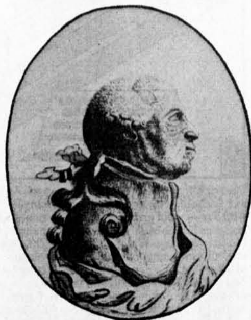
... Porträtzeichnung in einem studentischen Stammbuch (Abb. 3): Unentbehrlich für die Forschung